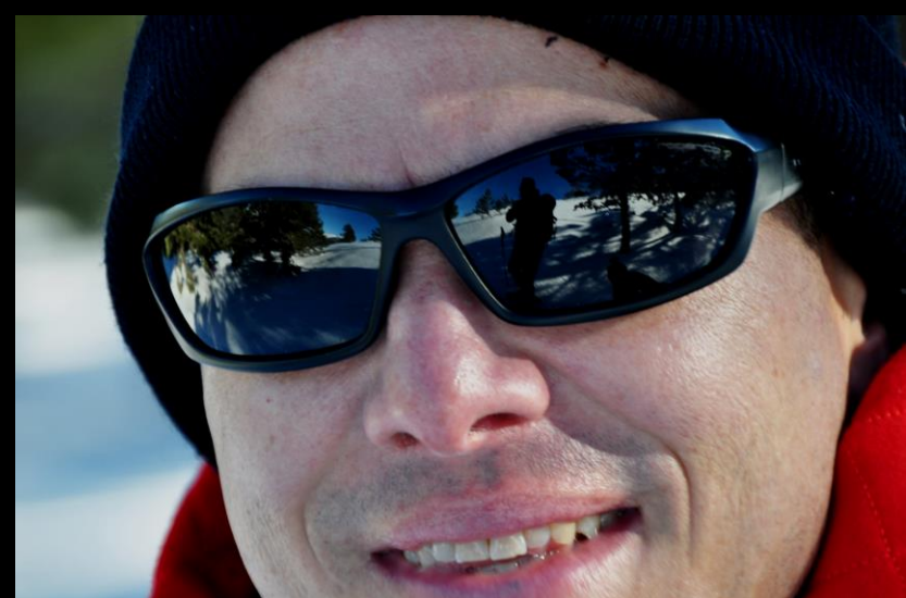
Los protagonistas en el antes