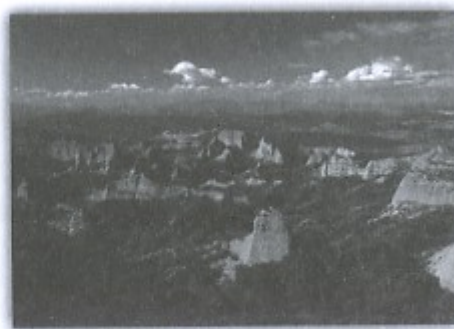
Fotografía 6. Paisaje Minero de las Médulas declarado en 1997 Patrimonio de la Humanidad (León)